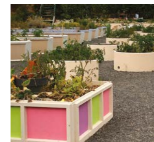
Jardins en bac pour personnes à mobilité réduite

Grâce à une subvention de la DREAL et de l'ARS, la mairie a recruté une stagiaire en dernière année de géographie, afin qu'elle réalise une étude de faisabilité et une enquête portant sur les attentes de la population.