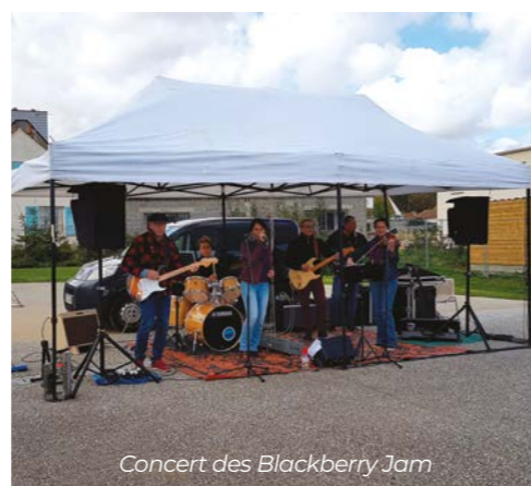
Concert des Blackberry Jam