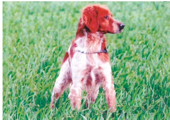
Lobo des Landes de Pavée, vainqueur du concours couples Mars 2020