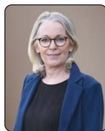
Florence BOULAY Maire du Castelet