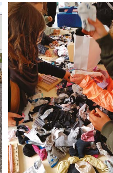
Surfrider, le jour de la journée de ramassage des déchets au Castelet et fabrication d'éponges Tawashi avec les enfants.