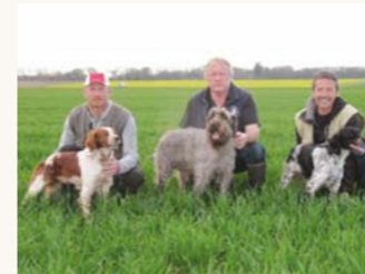
Trois Normands au barrage après avoir obtenu tous les 3 le CACT sur perdreaux sauvage à Garcelles-Secqueville.