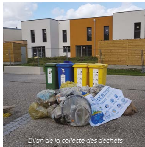
Bilan de la collecte des déchets

Merci au Club Image pour leur reportage photos tout au long de la journée.