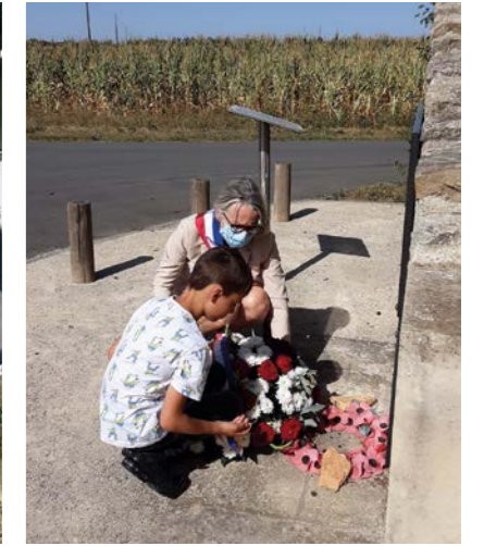
14 JUILLET 2020