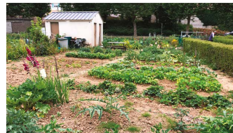
Exemple de parcelles cultivées