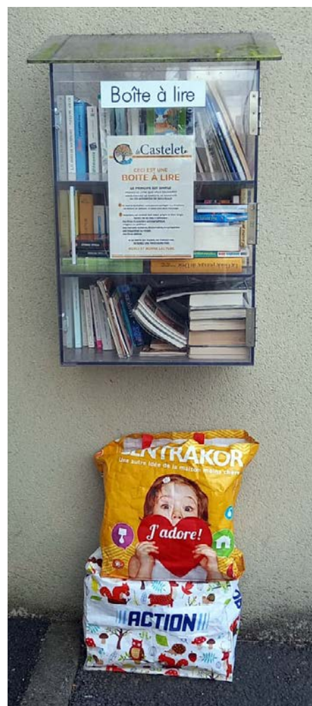
Merci de ne rien déposer en dehors des boîtes à lire

Afin de préserver un environnement agréable, nous comptons sur le civisme de chacun pour qu'aucun dépôt ne soit effectué aux abords.